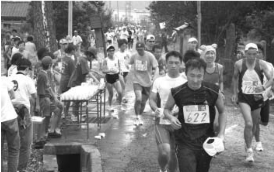
「小布施見(見)ミミ」(ママラン)でいい汗流そう(長野県小布施町)