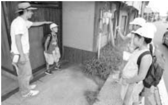
町遺産・まち歩きワークショップ

にも大きな転換が求められている今、施策の重要性や緊急性の視点から、少ない財源を効率的に配分するとともに、今まで以上に町民のまちづくりへの理解と参加が不可欠です。この計画は、町民と行政が一緒になって考え、共に行動し、「協働」していかなければ、実現し得ないものです。しかし「いにしえ」から小布施人に連続と受け継がれてきた郷土を愛する心と、過去数十年にわたり育まれてきた小布施流の協働のまちづくりの理念があれば、計画は実現できると確信しています。