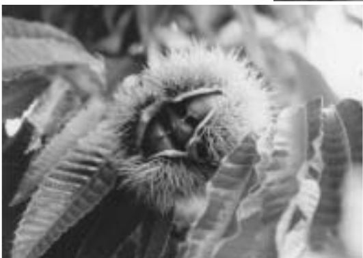
栗の小径と小布施栗

を利用した流通が盛んになるとともに、越後小千谷・十日町から中野を経て上州に至る大笹街道と、直江津・高田から柏原・豊野を経て山田街道へ抜ける道が物産・交易で賑わい、小布施町は北信濃の経済・文化の中心として栄えました。この賑わいの中から生まれた豪農・豪商たちは、葛飾北斎、小林一茶ら多数の文人墨客を招き、今に続く文化の薫り