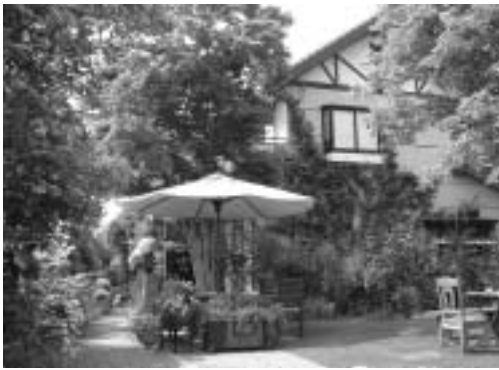
オープンガーデン

昭和50年の中学校緑化部から始まった花づくり運動は、育成会や老人会、自治会を通じて全町に広がり、町民グループによる花づくりが盛んに行われるようになりました。平成4年には、北斎の鳳凰図をモチーフにした回遊式の花壇や観賞温室を備えた花の公園「フローラルガーデンおぶせ」が開園し、多くの人が訪れるようになりました。さらに平成9年には、花の育苗施設「お