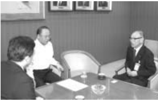
武部自民党幹事長(中)に要請