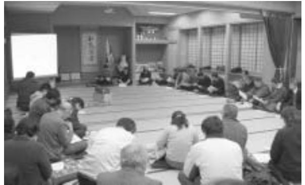
住民懇談会(後期基本計画)の様子

ながら、先人が築きあげてきた小布施町の歴史・文化・自然などをより一層豊かにし、次代に伝えていくことである」と将来ビジョンはまとめられています。