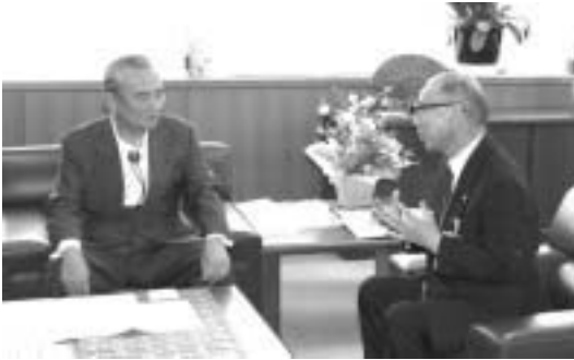
中馬行政改革担当大臣(左)に要請する青木全国町村会副会長

よって、公立学校施設整備をはじめ、地方行政全般に責任を持つ地方公共団体の長が、一体的に教育行政に意向を反映させることができるようにするため、心置規制を緩和し、地方公共団体における教育行政の実施について、教育委員会を設置して行うか、長の責任の下で行うか、選択可能な制度とするよう強く要望する。