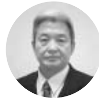
高知県町村会長 津野町長