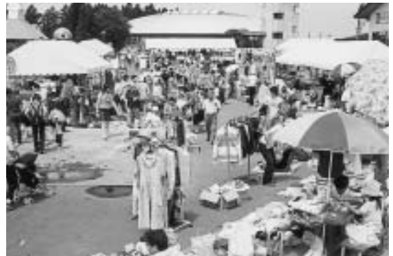
エコランドでのフリーマーケット

し、厄介者の悪風を地域資源として活用した取り組みが、テレビや新聞、雑誌等で度々取り上げられ、町内外、更に全国にPRされていることから、住民にとって町の誇りとしての意識が定着し、自信にもつながっています。また県外に住む町出身者からも、出身地を誇れるものとして高く評価されています。