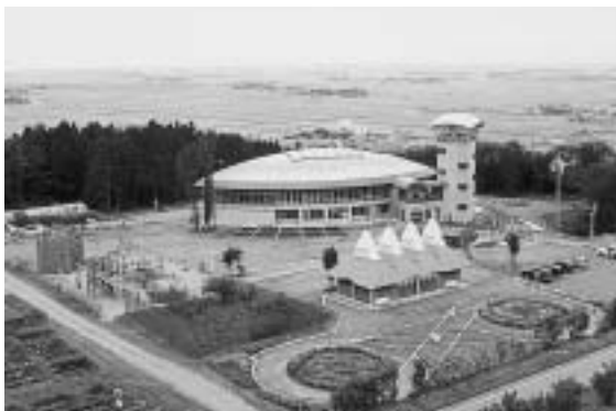
「風車村」ウィンドーム周辺

を総合的に進めており、シンボル風車周辺は「風車村」として位置付けられ、施設整備が図られてきました。平成七年度にオープンしたウィンドーム立川は、風の資料室や多目的アリーナ、風車の発電した電気を充電に使用した子供バッテリーカー広場、大型木製遊具広場などが整備され、観光と教育的要素を兼ね備えたゾーンとしての役割を果たしており、施設の利用者は年間五万人を超えています。また、風を芸術的にとらえ風の町の景観を高めるために、世界的に活躍している風の造形作家新宮晋氏の風のモニュメント二作品を街角に設置して、立川町の自然のリズムを表現しています。