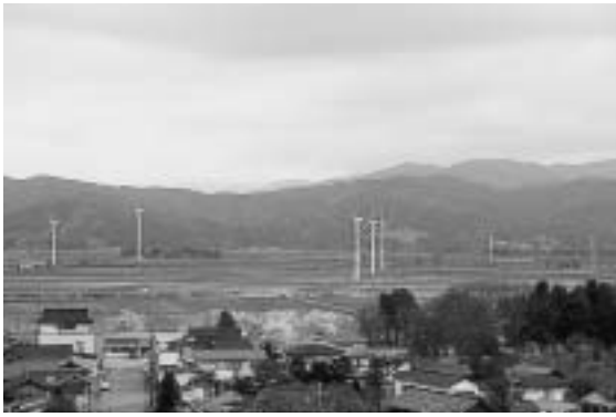
田園地帯の風車群

に、風をテーマに地域活性化を進める市町村が参加し、当町で平成六年開催した「第一回全国風サミット」が縁となり、国内初の風力発電を行う民間会社が最上川沿いの田園地帯に、平成八年デンマーク製の四〇〇kW風車二基を建設しました。その後この会社に町が出資して設立された第三セクターにより、平成九年度から十一年度までの継続事業で六〇〇kW風車四基が建設されました。