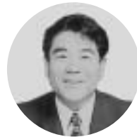
長野県 野村 長 長 野 村 長 かわ 上 村 長 藤 原 忠 彦