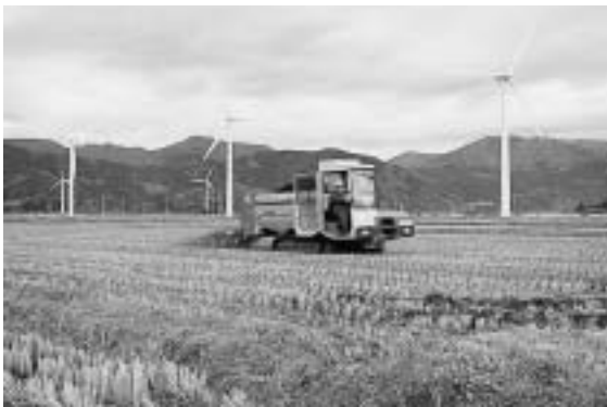
生ゴミからのコンポスト散布

立川町は、これまで地域特性を生かした身近な環境対策として、環境にやさしいクリーンエネルギーである風力発電の導入を推進するとともに、昭和六十二年に立川町堆肥生産センターを設置し、町内で発生する生ゴミの全量を粉殻や畜糞と混ぜてコンポストを生産しており、安全で土にやさしい有機質完熟堆肥として水田に還元し有機米生産に結び付け、有機農業と資源循環型社会の形成に取り組んできました。