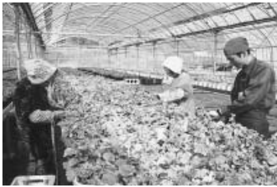
ワーキングホリデー

床栽培、木製品加工所の建設)⑧泊まりの庄建設(双子キャンプ村の整備、西米良迎賓館の整備)