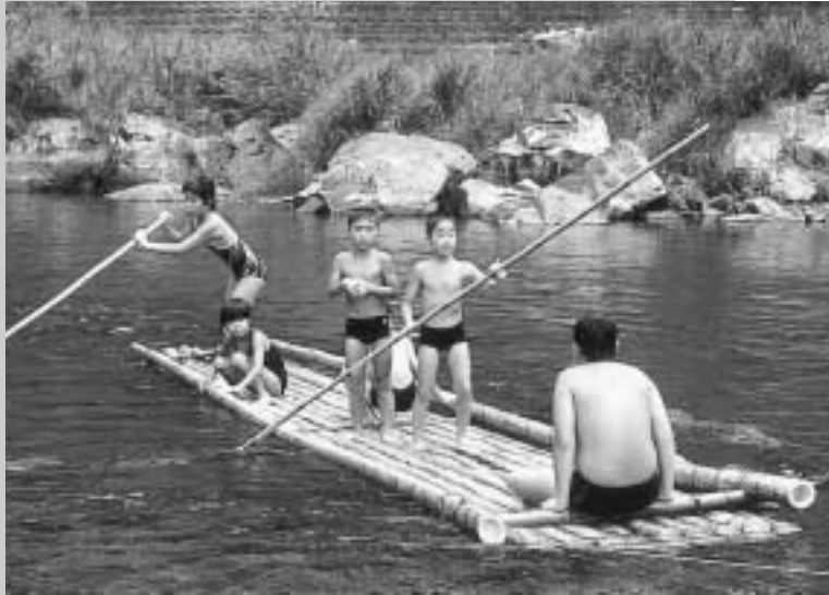
清流・一ツ瀬川で遊ぶ子供たち