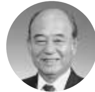
府 長 阪 町 大 崎 岬 中 出 春 次

昭和三十年四月に四ヶ町村が合併し誕生した『岬町』は、大阪の最南端に位置し、海あり山ありの風光明媚な環境と人情豊かな町であります。