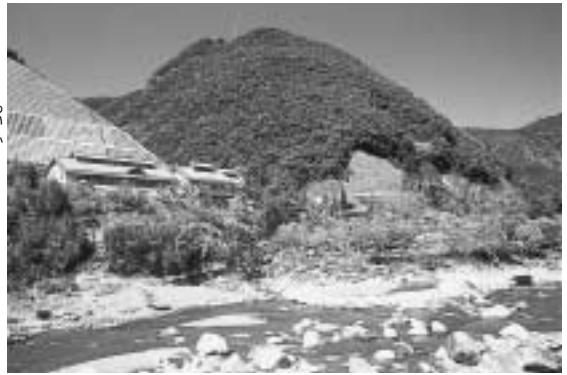
西米良温泉・双子キャンプ村

へ入山、隈府城(菊池市)落城により、菊池氏が米良へ落ち、名を米良氏に変えて、版籍奉還までの約五百年にわたり米良一帯を治めてきました。その長い歴史の中で、神楽・焼き畑農耕・食文化など優れた山村文化が伝承されて、菊池精神も脈々と受け継がれ長い歴史とともに誇れるものとなっています。 近年の観光動向を見ると、「集団観光」から「少数観光」、「見る観光」から「する観光」に移っており、田舎志向、本物志向、個性志向、自分好み志向が強まり、手軽で温泉もあり、かつ特色ある滞在型観光地が望まれているといえます。先に述べたとおり西米良村